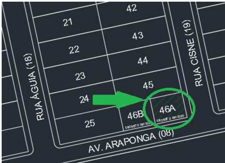
Figura 02 – Mapa do Município – localização do imóvel