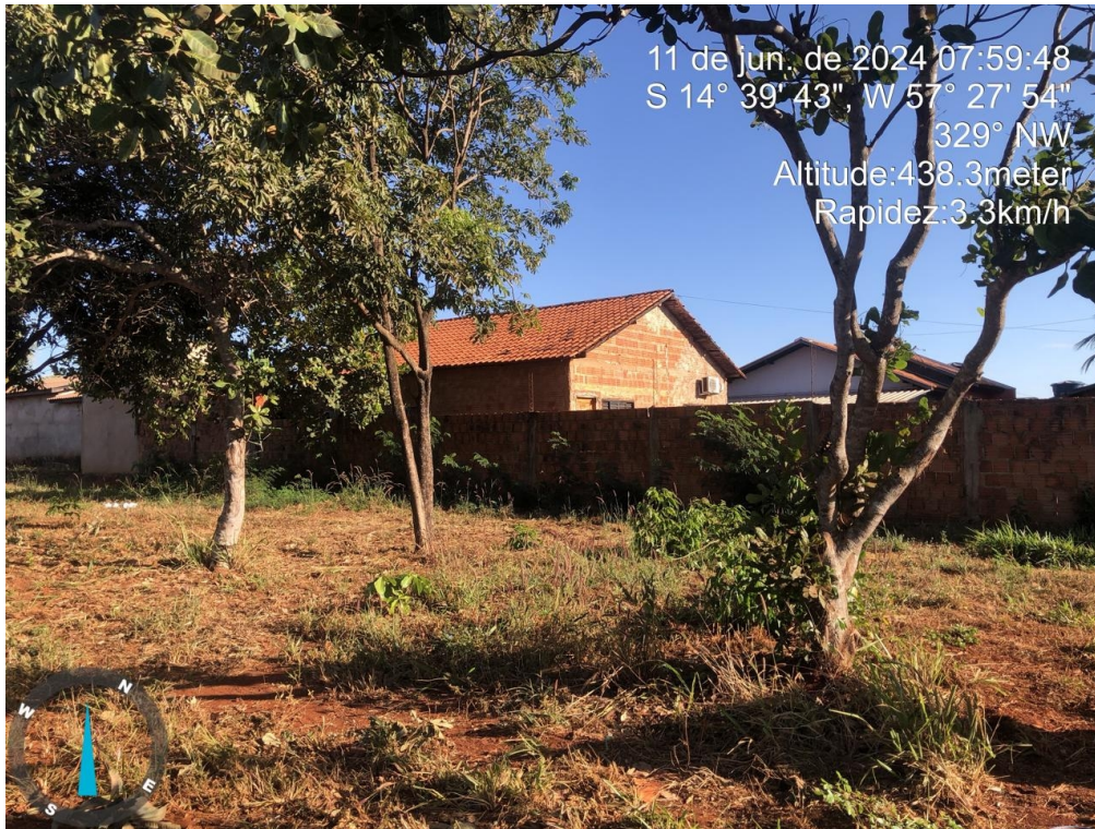
Figura 04 – Vista lote 46-A quadra 36, lateral para Av. Araponga