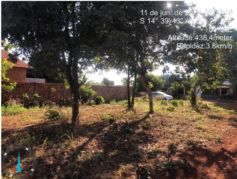
Figura 04 – Vista lote 46-B quadra 36, lateral para lote 46-A