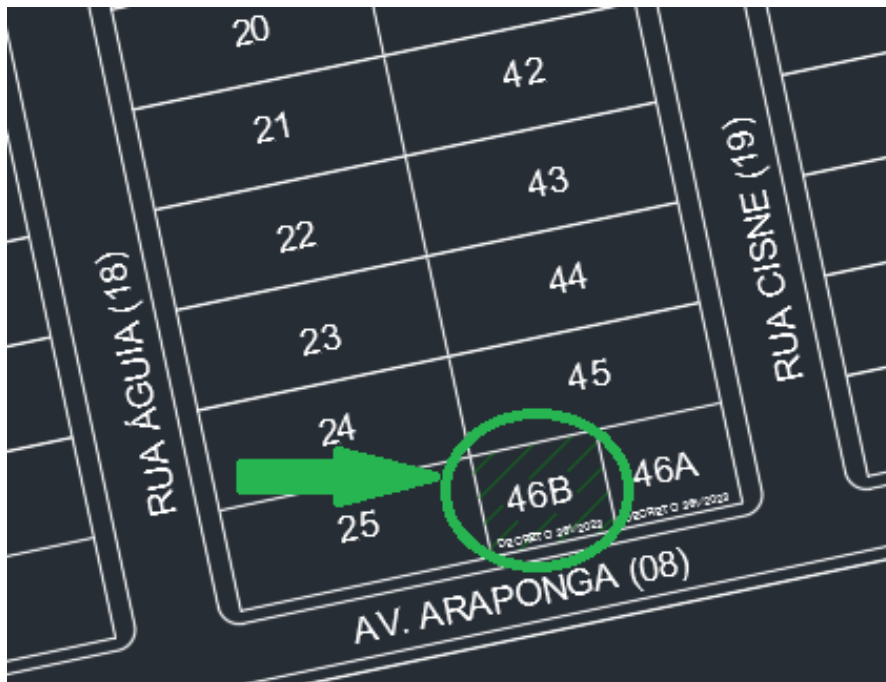
Figura 02 – Mapa do Município – localização do imóvel