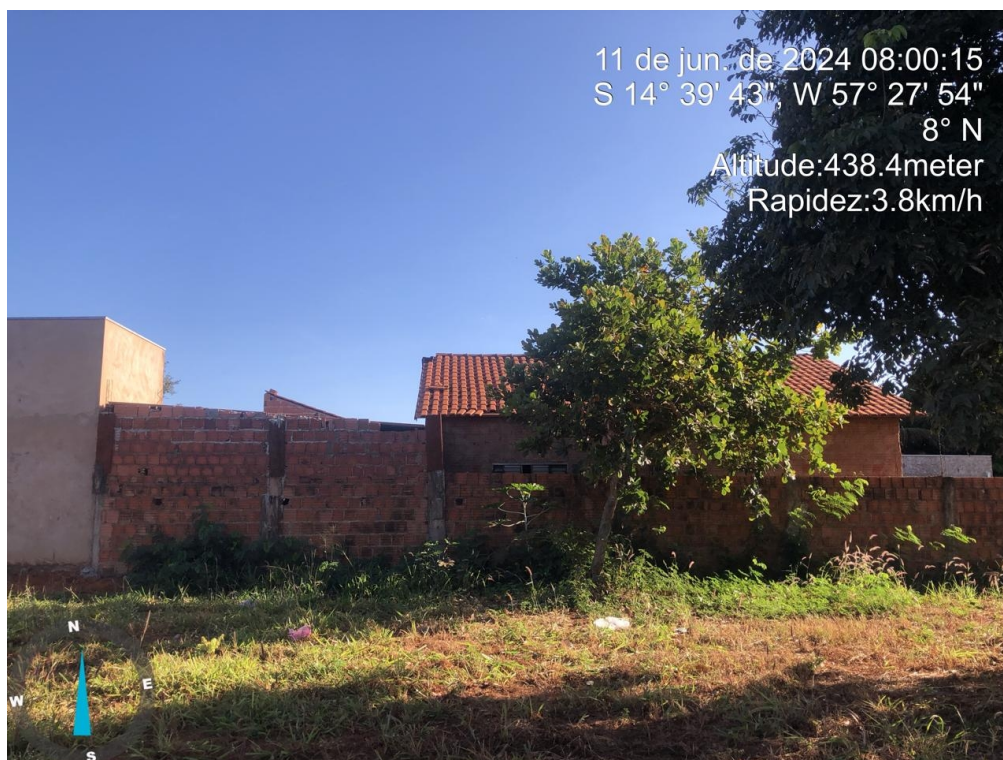
Figura 03 – Vista lote 46-B quadra 36, frente para Av. Araponga

Trata-se de um imóvel inserido na malha urbana de Tangará da Serra, na ZAS - Zona de Adensamento Secundário, infraestrutura básica, baixa intensidade de tráfego de veículos e pedestres, tipologia de ocupação residencial, topografia plana, como demonstrado nas figuras 03 e 04.