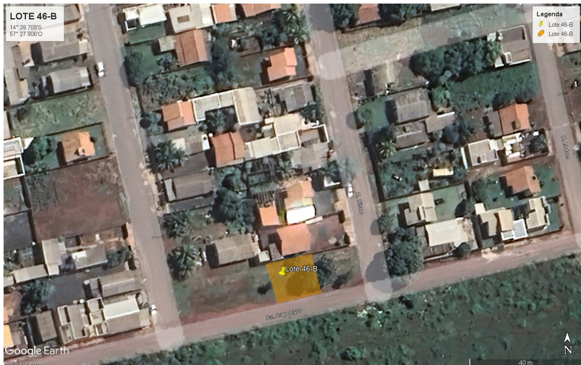
Figura 01 – GOOGLE EARTH EM 11-06-24 (imagem de 01-03-2024) Adaptado por Departamento de Estudos e Projetos/Seplan

Lote urbano denominado Lote 46-B, quadra 36, Av. Araponga, Loteamento Alto da Boa Vista, bairro Jd. Alto da Boa Vista, possui medidas de 15,00 m x 12,00 m, prefazendo área de 180,00 m 2 , matriculado sob nº 44.225, conforme demonstra figuras 01 e 02.