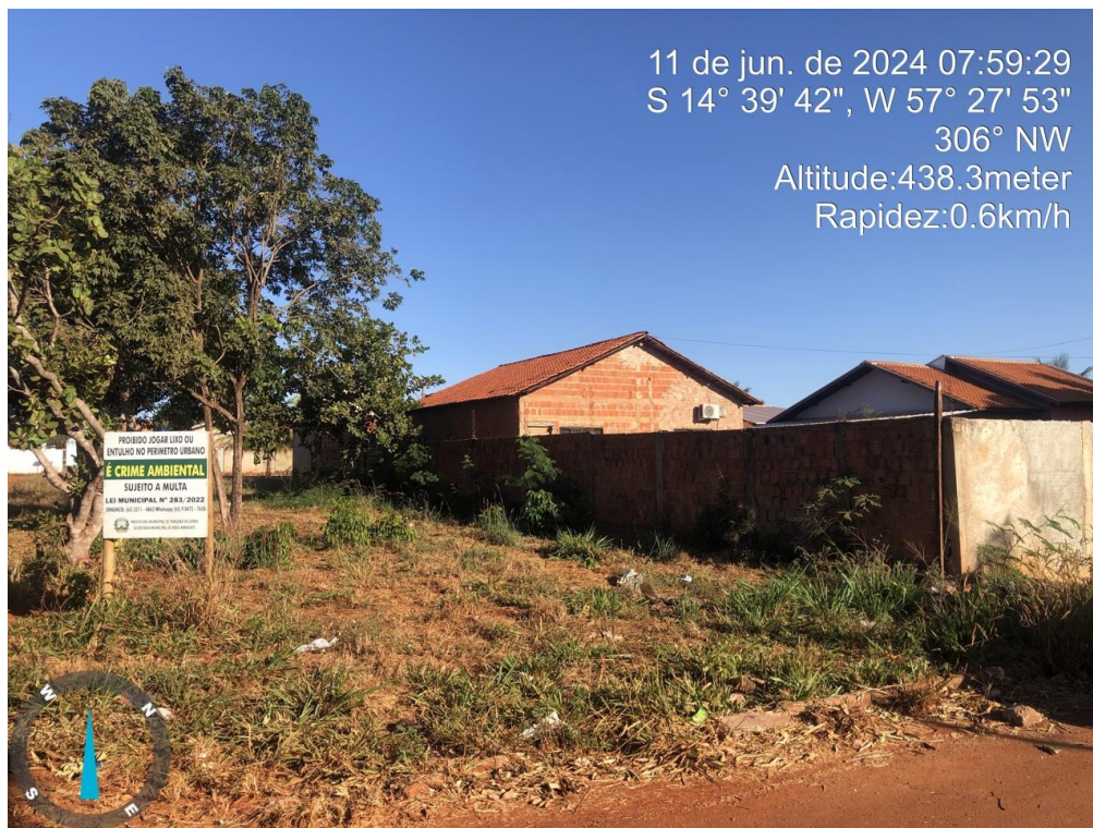
Figura 03 – Vista lote 46-A quadra 36, frente para Rua Cisne

Trata-se de um imóvel inserido na malha urbana de Tangará da Serra, na ZAS - Zona de Adensamento Secundário, infraestrutura básica, baixa intensidade de tráfego de veículos e pedestres, tipologia de ocupação residencial, topografia plana, como demonstrado nas figuras 03 e 04.