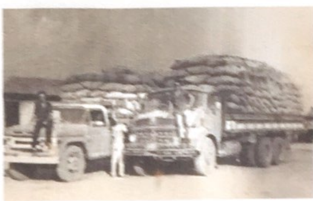
Carregamento de produção de cereais de sua propriedade