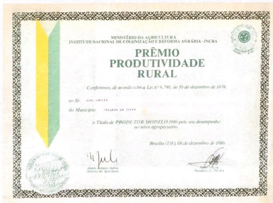
Título de PRODUTOR MODELO no ano de 1980, concedido pelo Ministério da Agricultura e Instituto Nacional de Colonização e Reforma Agrária - INCRA, assinado pelo Ministro da Agricultura - Angelo Amaury Stabile e pelo Senhor Pedro Yokota - Presidente do INCRA.