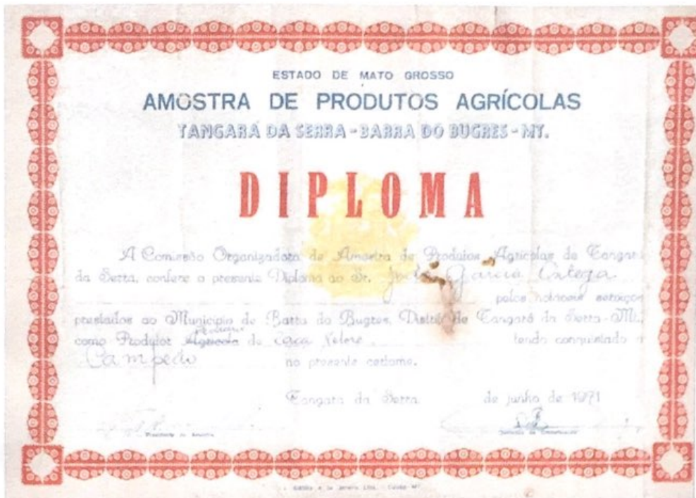
Diploma pelos notáveis serviços prestados como Produtor Pecuário da Raça Nelore.