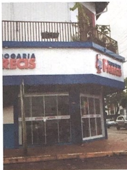
Foto atual do local onde era a CASA ESTRELA naquela época (Av. Brasil, 528-W esquina com Sebastião Barreto (8)).

Finalmente no dia 11 de janeiro de 1965 chegou com sua família, agora composta por sete membros, ou seja, cinco filhos. Nesse mesmo ano foi privilegiado com o nascimento de mais uma filha, Sirlei.