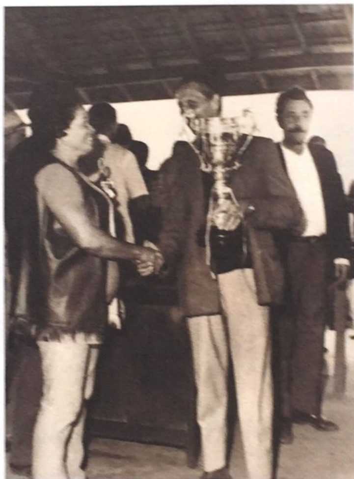
Na foto acima, no ano de 1971, recebendo premiação, como Produtor Pecuário da Raça Nelore (época que ainda tinha cabelo).